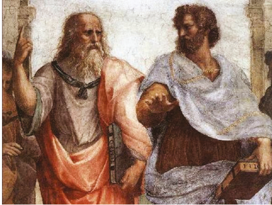
Figure 1.B : École d'Athènes, fresque de Raphaël Platon montre le ciel (monde des idées, transcendant) Aristote désigne la terre (monde sensible, immanent)

Cette Réalité lui est dévoilée par la science (physique, astronomie, biologie) et les traditions initiatiques (orientales ou occidentales, peuples premiers). Comme le prisonnier libéré, l'homme devra s'adapter à l'éclat de la lumière hors de la grotte. Mais de multiples outils, d'une puissance inégalée, lui sont maintenant offerts, pour dépasser ses limites. Un certain nombre est issu des enseignements des peuples anciens (Mayas, Aztèques), des traditions orientales (yoga, zen, ayurvéda), des milieux initiatiques occidentaux (alchimie, ésotérisme chrétien, Rose+Croix ou anthroposophie). D'autres outils, en lien avec l'univers et les ouvertures de conscience sont spécifiques de notre époque (respiration holotropique, quantum touch , EMDR).